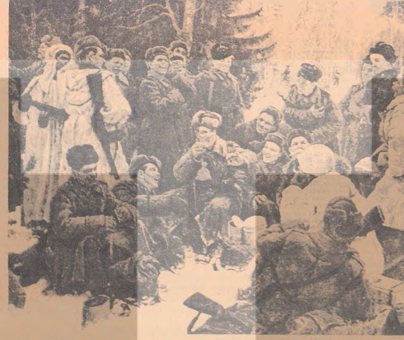
Sosyalist Sovyetler Birliğine saldıran Faşist Alman Ordularına karşı yiğitçe savaşan Sovyet partizanlarından bir grup dinlenme sırasında. Alman işgali altında bulunan bölgelerde verilen partizan savaşına Kızıl Ordunun zaferini hazırladı.