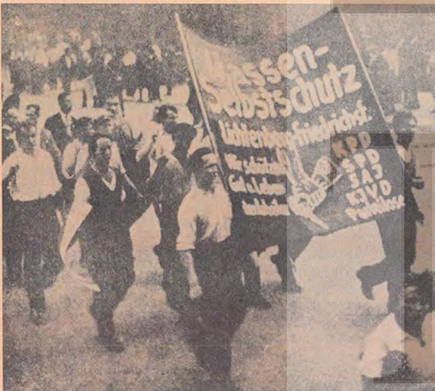
Kommünistlerin Berlin Yürüyüşü - Temmuz 1932 Alman Kommünistleri, Nazilerin her türlü baskı ve terörüne rağmen mücadelelerini sürdürdüler.