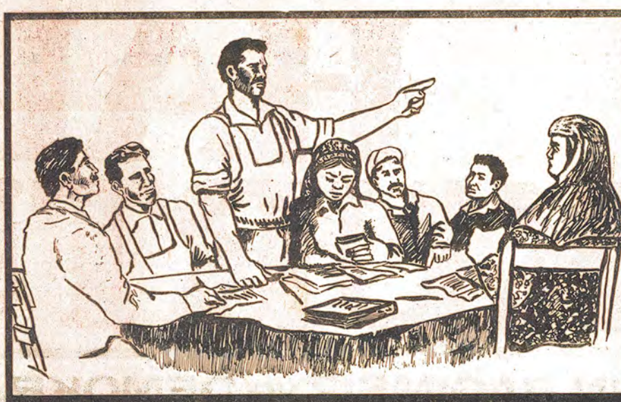
teori yolunu aydınlatıyor